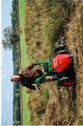
Pflege einer Nasswiese, teils in Handarbeit, teils maschinell unterstützt

Anpacken und mitmachen heißt die Devise, wenn der Landschaftspflegeverband Mittelfranken von Juli 2022 bis Januar 2023 zu einer 6-tägigen Fortbildung in Sachen Landschaftspflege einlädt. Wer wissen möchte, wie man zum Erhalt unserer wertvollen und einzigartigen Landschaft aktiv beitragen kann, ist hier richtig. Ganz konkret lernen die Teilnehmer/-innen einen Magerrasen von Sträuchern und Büschen zu befreien, damit der Schäfer wieder beweidet kann, Hecken fachgerecht zu pflegen und Feuchtwiesen so zu mähen, dass der Lebensraum von Orchideen und Schmetterlingen erhalten bleibt. Streuobstwiesen, Hecken und Bäume werden gepflanzt sowie der Umgang mit den entsprechenden Maschinen und Gerätschaften erprobt. Auch Arbeitssicherheit und steuerliche Aspekte einer Erwerbstätigkeit in der Landschaftspflege sind Inhalte der Weiterbildung. Neben der Vermittlung theoretischer Hintergründe und Aspekte liegt der Schwerpunkt dabei auf der praktischen und angewandten Landschaftspflege, die anschließend zum Einsatz im Gelände befähigt.