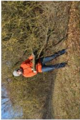
Gehölzpflege einer verbuchten Schafhaltung